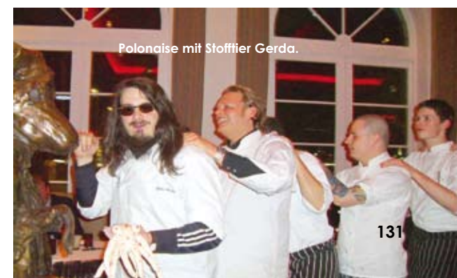
Polonaise mit Stofftier Gerda.

Zu späterer Stunde zettelte Meese dann noch eine Polonaise mitsamt der Küchencrew an, vorneweg Stofftier Gerda. Wie beim Traumschiff-Kapitän's-Dinner, nur lässiger.